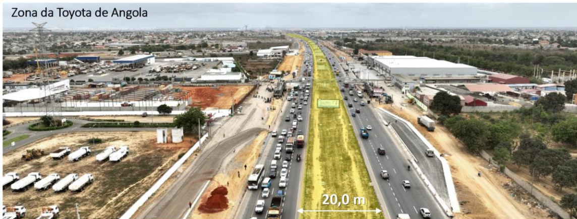
Zona da Toyota de Angola

Secção Transversal: tira partido da disponibilidade de espaço no canteiro central da Av.ª Fidel Castro Ruz, 20 m uniforme.